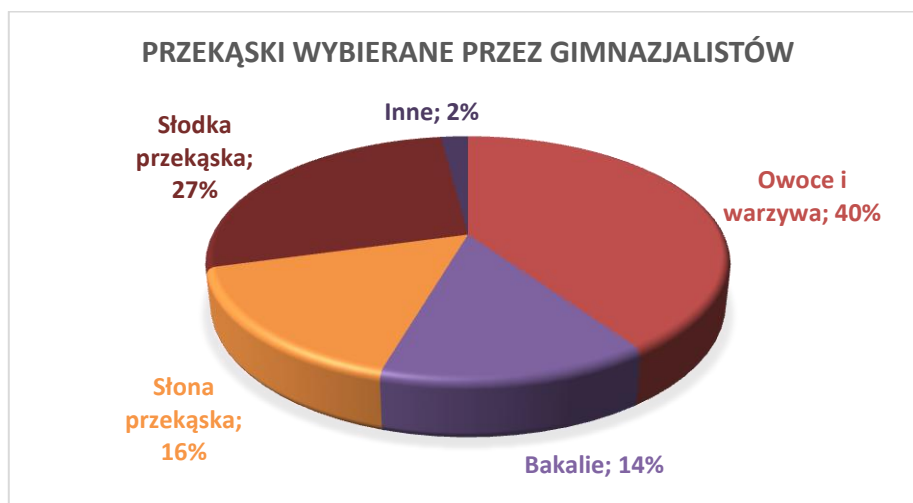
Tabela 2. Wyniki ankiety przeprowadzonej wśród młodzieży gimnazjalnej podczas trwania 6 edycji programu edukacyjnego marki WINIARY „Żyj smacznie i zdrowo”

owoców. Do ideału wyznaczonego przez Instytut Żywności i Żywienia, czyli spożywania warzyw lub owoców tak często jak to jest możliwe w ilości przynajmniej 5 porcji dziennie z przewagą warzyw, wciąż jednak daleko zarówno dorosłym, jak i młodzieży w Polsce. Przebadani gimnazjaliści zdają sobie także sprawę z konieczności picia wody – aż 72% z nich zaznaczyło, że wypija zalecane 1,5 litra wody dziennie.